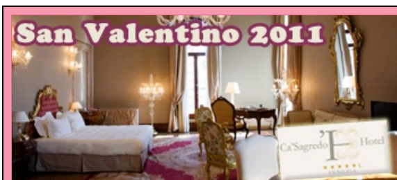
San Valentino Hotel Ca' Sagredo